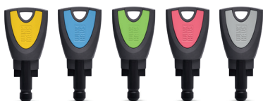
Nutzerschlüssel in 5 Farben