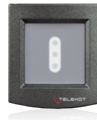
Moderne cryptlock- Zutrittskontrollleser aus dem Hause TELENOT sichern den Zugang der Firma Betzold.