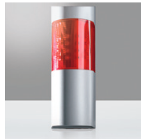
Der optisch-akustische Signalgeber von TELENOT verfügt über die höchste Sicherheitsklasse VdS Klasse C.

Alle Alarmanlagenkomponenten, die in der Arztpraxis verbaut wurden, erfüllen besondere Qualitätsansprüche. Permanente Funktionalität und absolute Zuverlässigkeit (24 Stunden am Tag, sieben Tage in der Woche) – und das über Jahre hinweg – sind dabei elementar. TELENOT-Produkte verfügen über Sabotagesicherungen, Abreißkontakte, Übersprühschutz und eine Notstromversorgung. Modernste Produktionsverfahren in Verbindung mit einer enormen Fertigungstiefe am Standort Deutschland garantieren Produkte auf höchstem Qualitätsniveau.