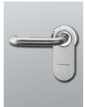
Digitaler Türbeschlag SmartHandle AX für Türen im Innenbereich