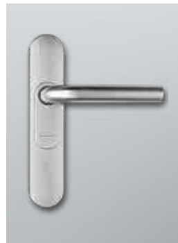
Digitaler Türbeschlag SmartHandle 3062 für Türen im Außenbereich

Der neue Innentür-Beschlag SmartHandle AX steht für die sprichwörtliche Intelligenz im Griff. Kompakte Bauweise, modularer Aufbau, attraktives Design und leistungsfähige Elektronik sorgen für höchsten Nutzerkomfort.