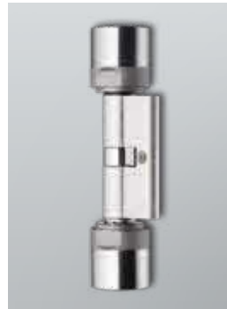
Digitaler Europrofil Doppelknaufzylinder

Der digitale Schließzylinder 3061 setzt in der DoorMonitoring-Ausführung neue Maßstäbe im Bereich der Objektsicherheit. Über seine Schließ- und Zutrittskontrollfunktion hinaus bietet er eine kompakte Türüberwachung. Ein Sensor in der Stulpschraube überwacht den Zustand und die Zustandsänderungen der Tür – diese Informationen werden aktiv über das WaveNet an die LSM Locking System Management Systemsoftware weitergeleitet und dort verarbeitet.