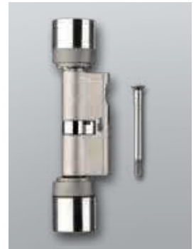
Digitaler Europrofil Doppelknaufzylinder mit DoorMonitoring