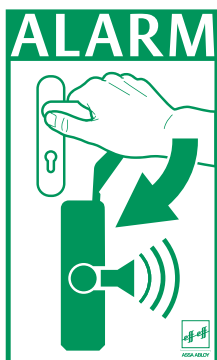
Warnschild gegen Missbrauch