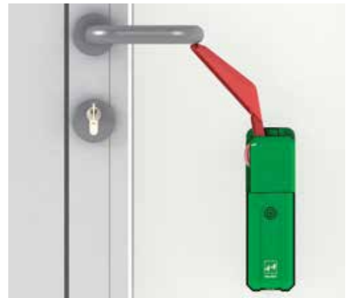
Montage auf Vollblattdüre