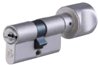
Profil-Knaufzylinder Nr. 815 WSM Messing matt vernickelt eine Seite Schließfunktion, andere Seite Alu-Knauf, F1, diverse Knaufformen erhältlich (abgebildet Form H)